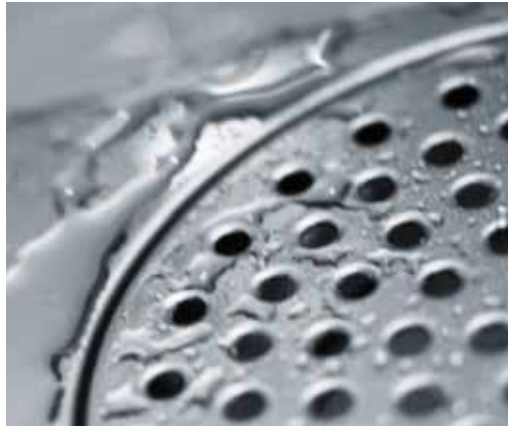
Vattenbrunnar är vanliga platser där du finner silverfisk.