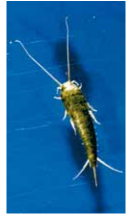
En silverfisk i närbild.

SILVERFISKEN ÄR ALLÄTARE och lever bland annat av de rester som samlas i golvbrunnar och avloppsrör. Favoritfödan är saker som innehåller stärkelse; klister, bokbindningar, socker, hår och mjäll. Den kan ibland göra