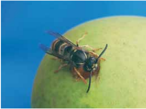
Wespen houden van het zoete sap van fruit en bessen.