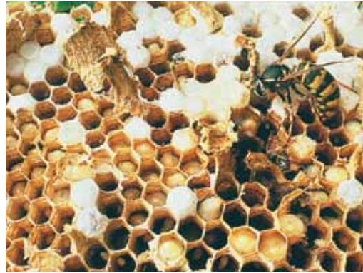
Een wespennest is naar beneden gehaald en doormidden gesneden. Je ziet de zeshoekige cellen en een werkster die voor de larven zorgt.

WESPEN HOREN THUIS in de natuur. Daar vervullen ze een belangrijke functie in de kringloop. Wespen zijn roofinsecten en dragen bij aan de sanering van andere insecten die schade aanrichten aan gewassen en bomen. Ze helpen met het verwerken van biologisch materiaal in de natuur. Op die manier houden ze de aantallen van andere schadelijke insecten in de hand. Eén wespennest kan in een zomer wel 4.500 larven vangen! Ze zijn ook belangrijk voor de bestuiving van planten. Pas als er mensen in de buurt zijn, kunnen ze tot irritatie leiden.