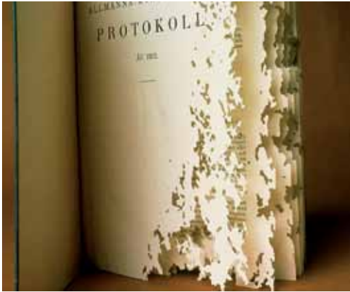
Zichtbare tekenen van aantasting door papiervisjes.