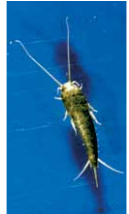
Een papiervisje van dichtbij.

PAPIERVISJES ZIJN ALLESETERS en leven van opgehoopte resten in afvoerputjes en afvoerbuizen. Het liefst eten ze dingen die zetmeel bevatten: lijm, boekbindingen, suiker, haren en roos. Ze kunnen soms oude boekbanden, papier of gesteven stoffen aantasten. Maar ook katoen, zijde of dode insecten zijn