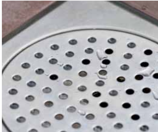
Zilvervisjes vind je gewoonlijk rond afvoerputjes.